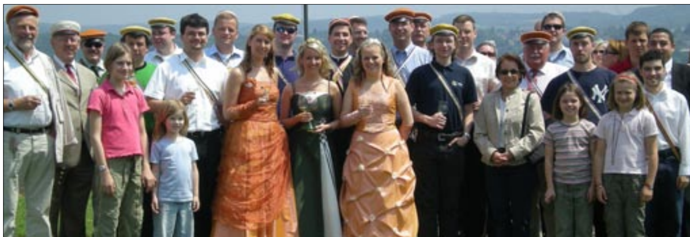
Nordgau Prag-Familienfoto zum Stiftungsfest